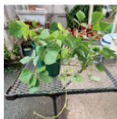
Pueraria lobata (クズ)